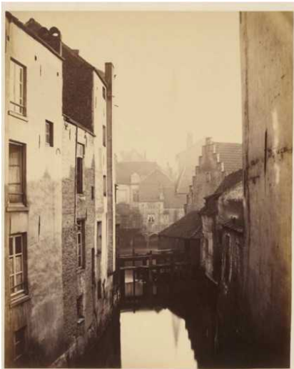
Louis-Joseph Ghémar, Zicht op de Zenne en de Ruyschmolen , in Sanering van de Zenne. Brussel in 1867 . Foto's genomen ter hoogte van de nieuwe boulevard die door de Stad Brussel zal lopen door de gebroeders Ghémar voor Belgian Public Works Company Limited © Archief van de Stad Brussel.

Het is interessant om het perspectief van Van Moer te vergelijken met dat van de fotograaf Ghémar.