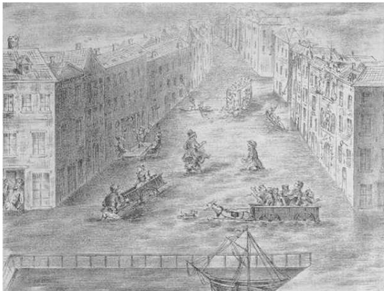
Anoniem, Overstroming van de Oude Graanmarkt , gravure, 1850

Een andere gravure, tentoongesteld in het Riolenmuseum, illustreert de overstroming van 1850 op de Oude Graanmarkt. Op de voorgrond zien we het Sint-Katelijnedok in de binnenhaven van Brussel. Het werd later opgevuld om de huidige Sint-Katelijnekerk te bouwen.