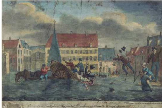
Gebroeders Willaume, Sint-Goriksheuvel overstromd , lithografie 1820

Op de afbeelding herkennen we de obeliskfontein die ooit het voormalige Sint-Goriksheuvel sierde en die vandaag nog steeds te zien is in wat nu de Sint-Gorikshallen zijn. De inwoners van de wijk zijn afgebeeld terwijl ze proberen te ontsnappen aan de overstroming. Daar gaat het om in de # Red_jezelf.