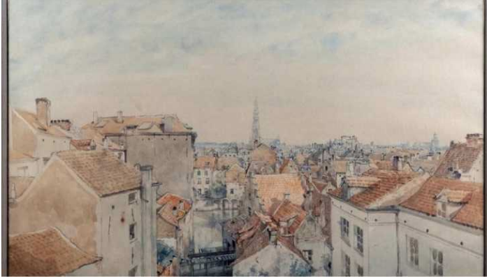
Jean-Baptiste Van Moer, Panoramisch zicht op het Stadhuis van Brussel , aquareltekening, 1868

Het is interessant om het perspectief van Van Moer te vergelijken met dat van de fotograaf Ghémar.