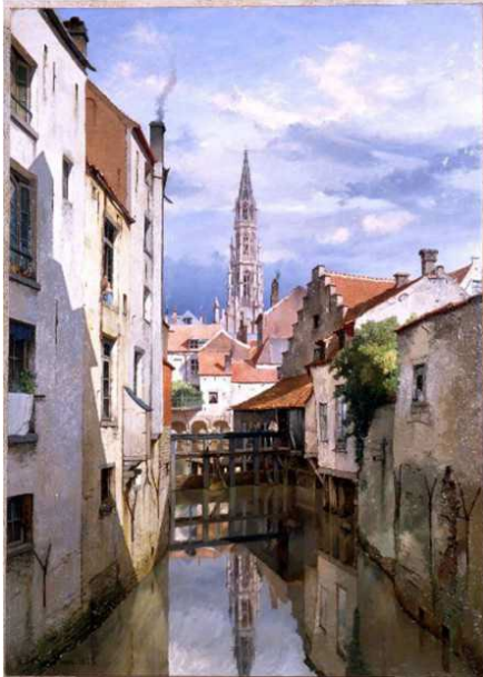
Jean-Baptiste Van Moer, Zicht op de Zenne en de Ruysmolen , olieverf op doek, 1873

In het centrum ontdekken we de watermolen, die de Ruysmolen genoemd wordt. Op de achtergrond zien we de herberg Den Beer rusten op de arcades en de torenspits van het Stadhuis.