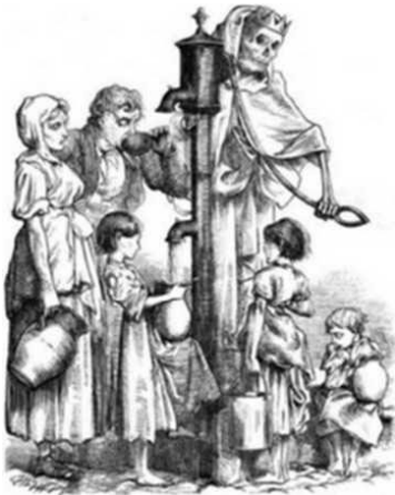
George Pinwell, Death's Dispensary , gravure, 1866

Deze # Bah_dat_stinkt verwijst naar de toen heersende miasmatheorie, die de oorzaak van epidemieën toeschreef aan de muffe lucht in de omgeving. Als reactie hierop benadrukte de hygiënist het belang van reinheid voor de menselijke gezondheid; ze voerden campagne om lucht en licht in de stad te brengen door oude wijken die als ongezond werden beschouwd te vervangen door nieuwe wijken die werden bediend door brede luchtwegen.