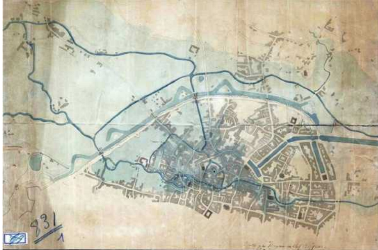
Jean-Baptiste Vifquain, Plattegrond van de uitzonderlijke overstroming van 20-21 januari 1820 , Tekening © Archief van de Stad Brussel, Administratieve fondsen Openbare werken, PP 0831-01

Een andere gravure, tentoongesteld in het Riolenmuseum, illustreert de overstroming van 1850 op de Oude Graanmarkt. Op de voorgrond zien we het Sint-Katelijnedok in de binnenhaven van Brussel. Het werd later opgevuld om de huidige Sint-Katelijnekerk te bouwen.