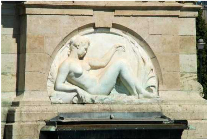
Martin Angenot, Detail van de Anspachfontein , foto, 2020

De sokkel in natuursteen is versierd met een bas-reliëf in wit marmer dat de overwelling van de Zenne uitbeeldt: Het gaat om een naakte vrouw onder een gewelf. Het werk is gemaakt door beeldhouwer Paul De Vigne.