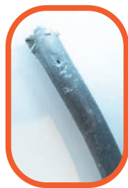
Tuyau en plomb