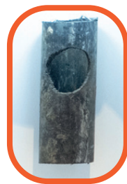
Gaine en mousse