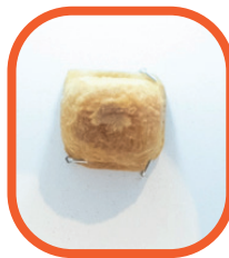
Savon de marseille